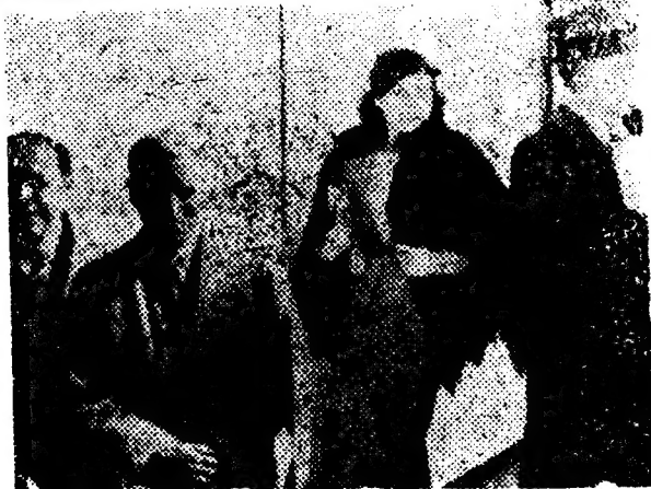
卓別麟·寶蓮高黛在滬留影(林澤民遺)

放映(德意兩國除外)備觀受眾歡迎，最近運至香港公映，賣座亦盛。上海因環境關係，未能映演，致使影迷無從欣賞，確是一件憾事。